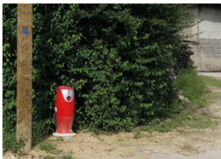
Suite à ce renforcement, un poteau à incendie a pu être installé.

Il était devenu nécessaire de renforcer le réseau d'eau potable pour alimenter les habitations de la route du Tremblay. Afin d'assurer et de maintenir un système de distribution d'eau efficace, et pour répondre à une demande des habitants, des travaux de renforcement de la canalisation ont été fait au printemps. La mare qui servait de réserve incendie communale est désormais la réserve privée de la ferme.