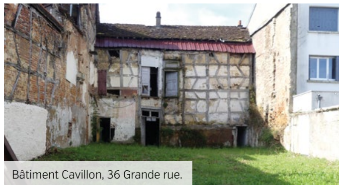
Bâtiment Cavillon, 36 Grande rue.

Propriété de la commune, suite à sa mise en péril en 2016, attenant au bâtiment du Crédit Agricole, est en très mauvais état. Une partie a déjà été démolie. Plusieurs études de structure ont été effectuées. Des travaux de confortement du mur mitoyen avec la maison au 35 rue de l'ancien collège ont déjà été réalisés. Afin de faire avancer le dossier, la mairie a fait intervenir un expert mandaté par le Tribunal Administratif. Ces 2 bâtiments étant imbriqués l'un dans l'autre, ils ont dû être expertisés tous les deux afin de déterminer exactement le danger qu'ils peuvent représenter. Le rapport de l'expert nous a imposé de prendre un arrêté de mesure de mise en sécurité procédure urgente [ex arrêté de péril imminent] pour les bâtiments au 35 rue de l'ancien collège. Des travaux d'étalement des murs mitoyens du bâtiment Cavillon sont à prévoir avant une éventuelle démolition. La mairie est en contact avec les propriétaires afin de trouver rapidement une solution permettant de mettre fin à cette situation.