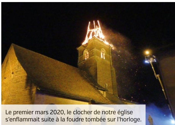
Le premier mars 2020, le clocher de notre église s'enflammait suite à la foudre tombée sur l'horloge.